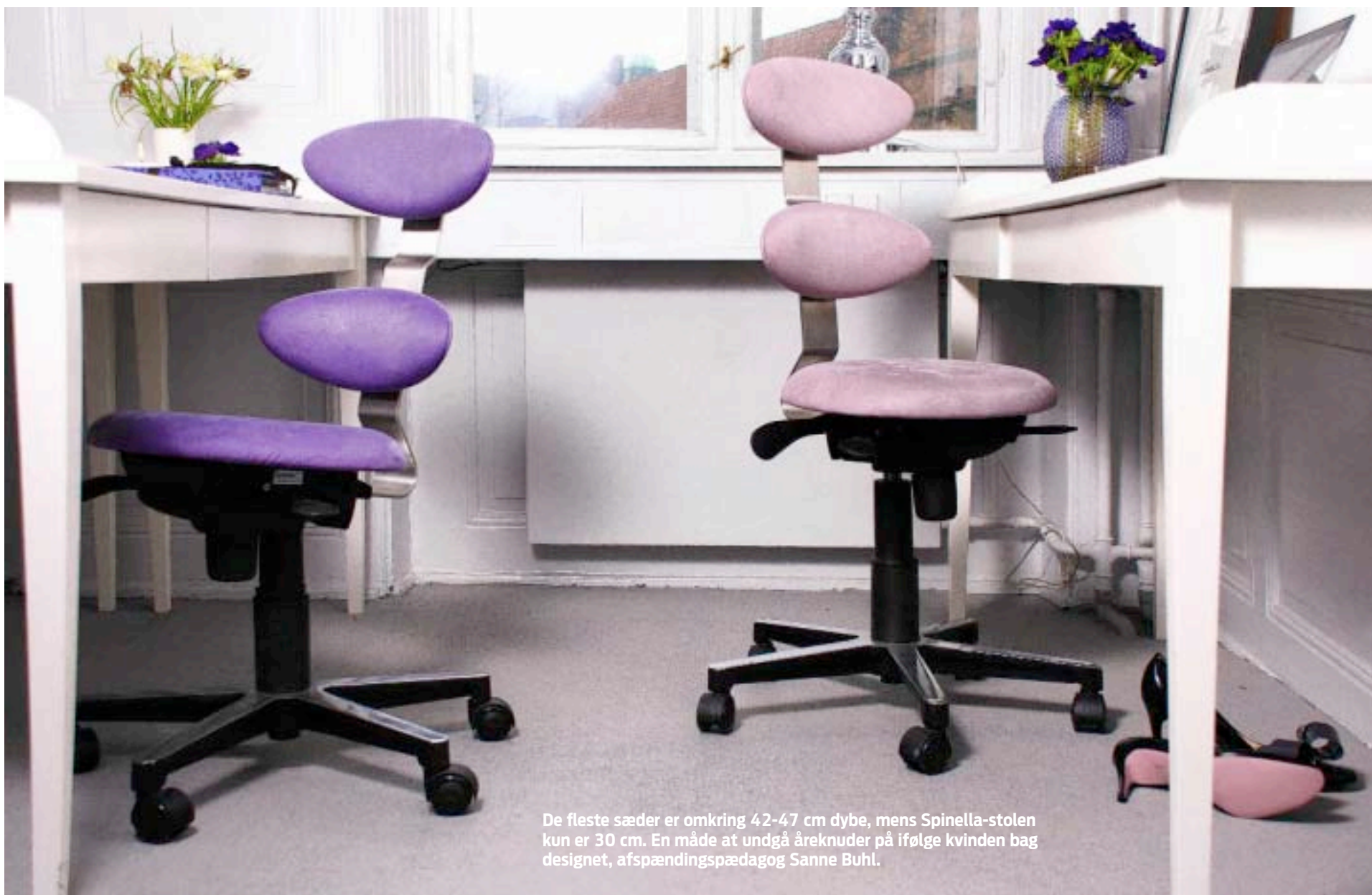
De fleste sæder er omkring 42-47 cm dybe, mens Spinella-stolen kun er 30 cm. En måde at undgå åreknuder på ifølge kvinden bag designet, afspændingspædagog Sanne Buhl.